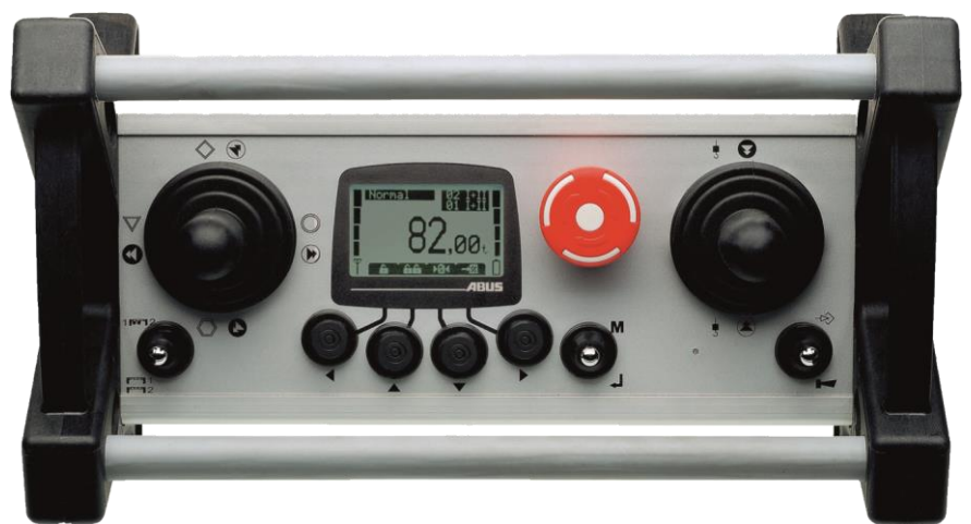
جوی استیک ریموت آبوس (خاکستری نقره‌ای)