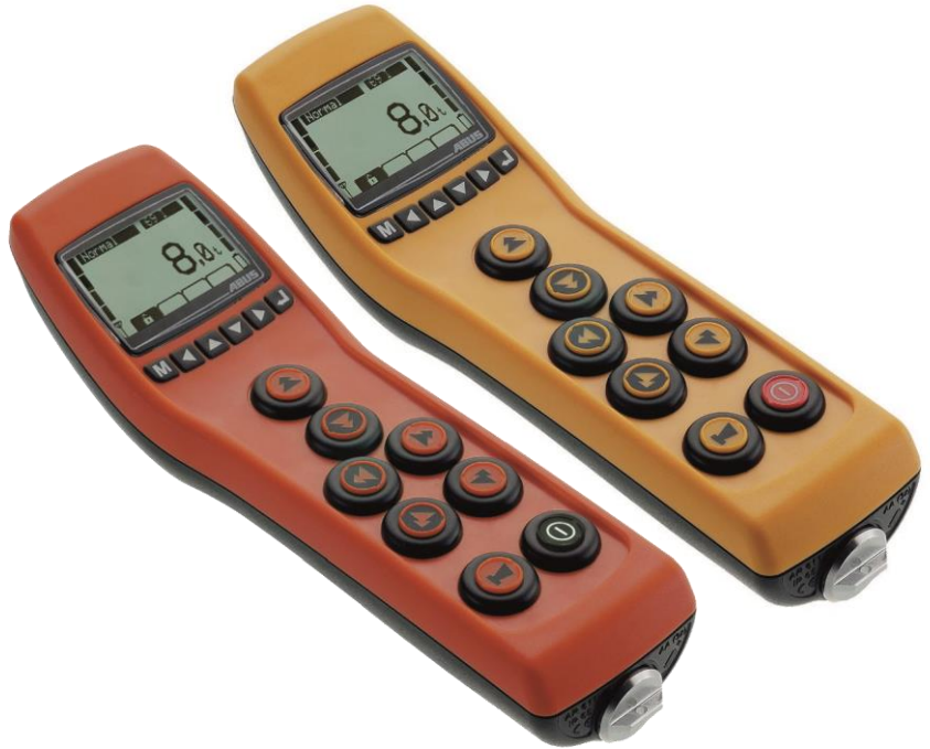
دکمه ریموت آبوس (زرد و قرمز)

از طریق صفحه نمایش با نور پس زمینه، اطلاعات مربوط به تنظیمات انتخاب شده، جرثقیل‌ها و بالابرهای فعال، قدرت سیگنال رادیویی و شارژ باتری نشان داده می‌شود. اگر یک سیستم نشانگر بار نصب شده باشد، وزن بار روی قلاب در صورت نیاز به صورت ناخالص یا خالص نمایش داده می‌شود.